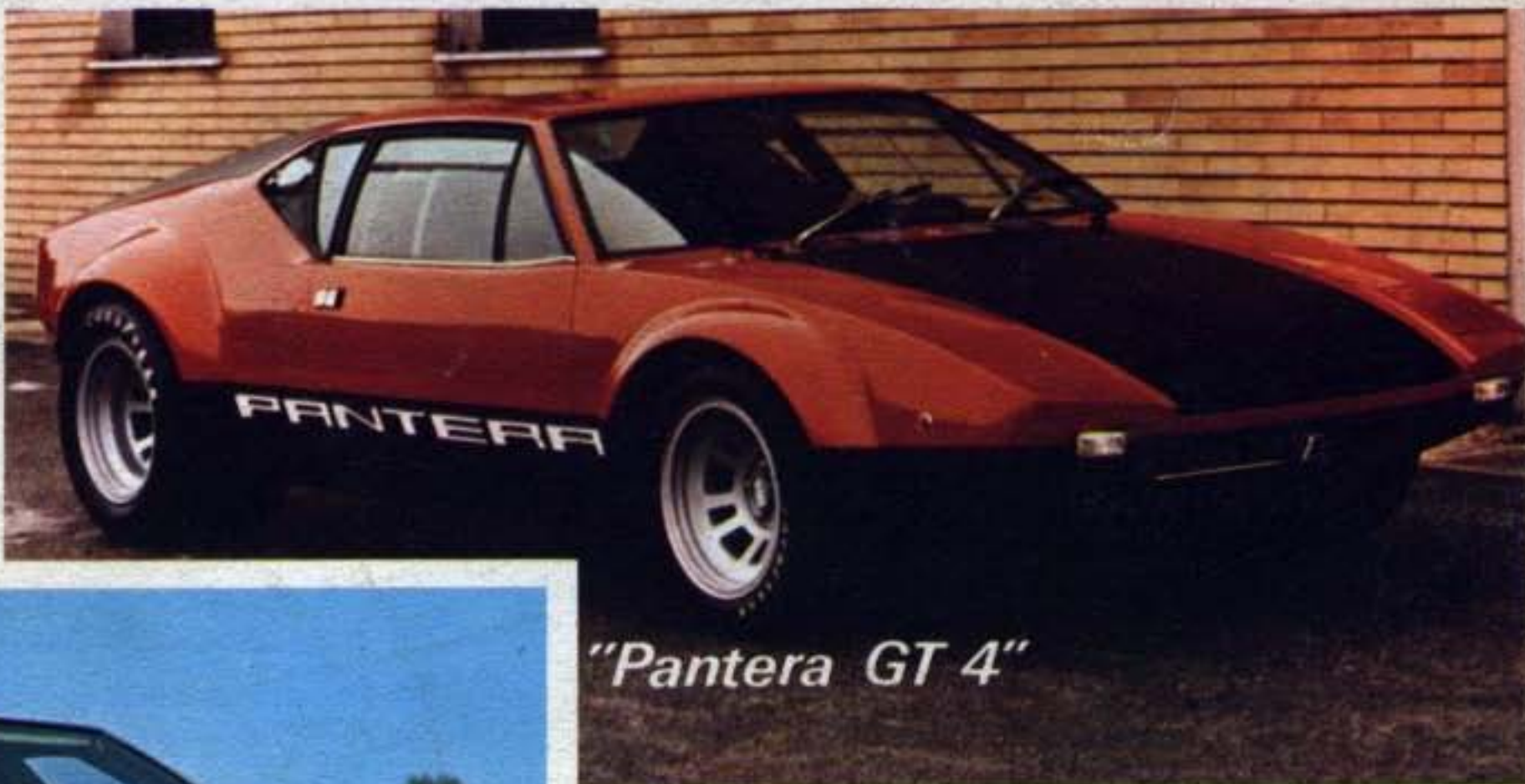
"Pantera GT 4"